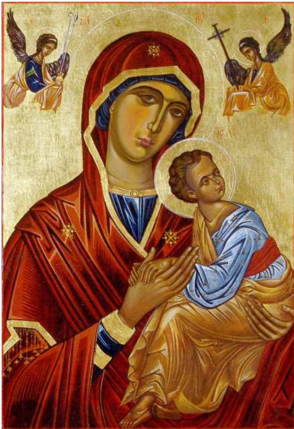
Maica Domnului a Patimii (Pankovits Aranka 2009)

nă în Ungaria”, este prima de acest gen în Ungaria. Sunt expuse aproximativ 70 de lucrări. Suntem foarte recunoscători organizatorilor de la Cifra Palota din Kecskemét.