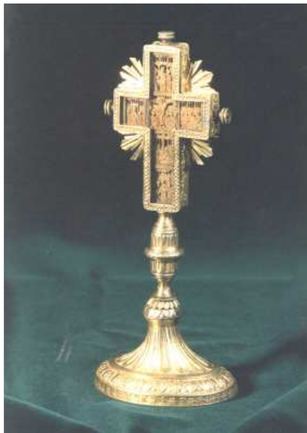
Cruce din sec. XIX (Orașul Mic Românesc, Giula)

colecției, ea își are deja propria istorie și a ajuns la un an aniversar. Nu putem să nu ne întrebăm prin urmare dacă s-au împlinit rosturile pentru care a fost înființată.