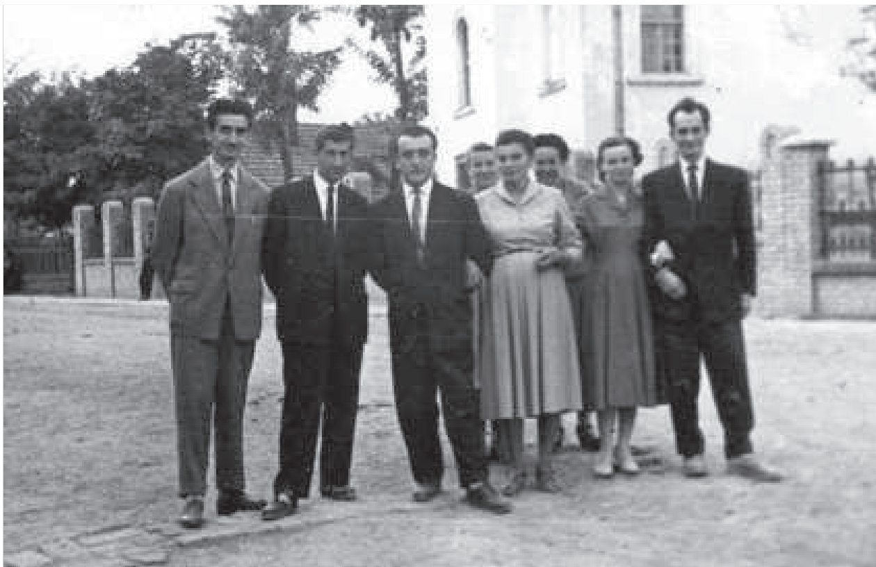
Dascăli din Micherechi în anul 1959