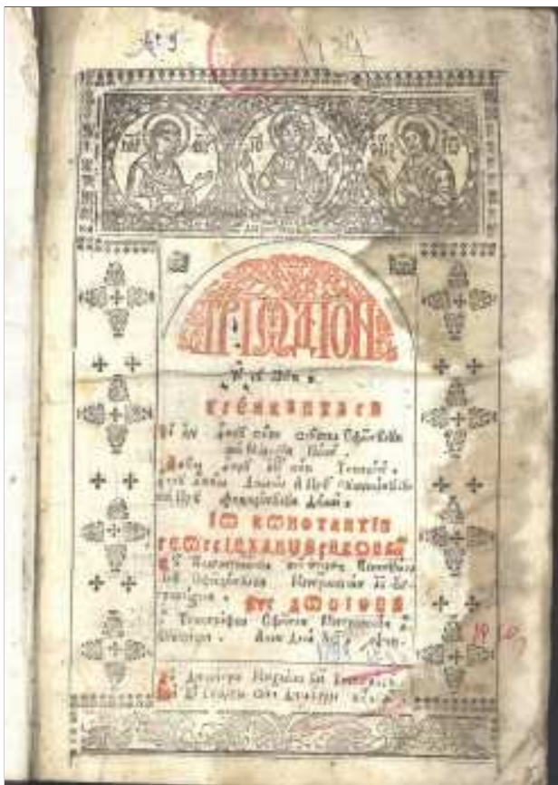
Triod din 1798, Giula

Privite la un loc, toate aceste valori de artă și carte constituie azi comoara culturală a românilor ortodocși. După 20 de ani de la consituirea