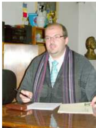
Florin Cioban (Oradea): Specificul școlii de frontieră – studiu antropologic despre școala din regiunile multiculturale româno-maghiare