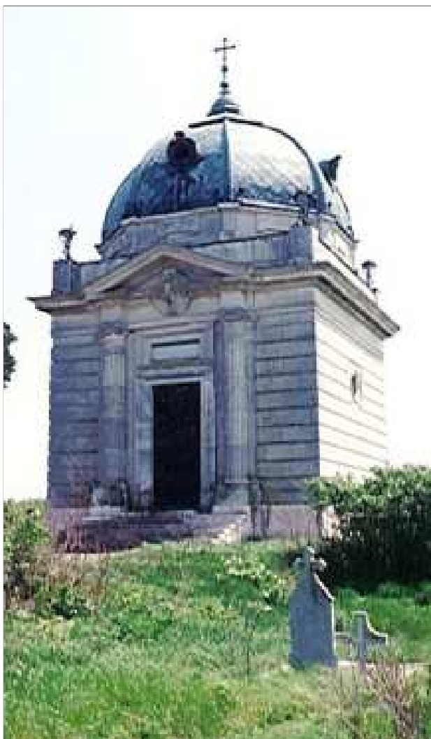
Mausoleul familiei Mocioni din Foeni

Rămîn înscrise cu litere de aur în paginile istoriei naționale cuvintele pe care Alexandru Mocioni le-a rostit în vremea în care a fost președintele ASTREI: „Astfel, domnilor, lupta pentru cultură este luptă pentru existență națională”. 35