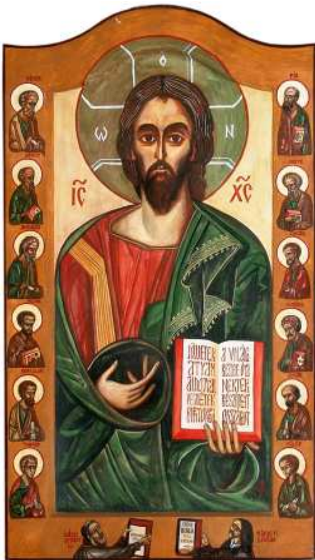
Judecătorul Hristos (Puskás László 1994)

Zugrăvirea icoanelor nu este un lucru neobișnuit în Ungaria, dar în orice caz, nu este un lucru cotidian. Înainte, prin secolele 17-18, s-au stabilit aici rusini de origine ortodoxă, sârbi, macedoromâni, greci, români și bulgari, care