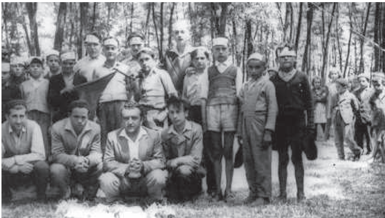
În cercul profesorilor și școlărilor din Micherechi în anii 1950

În anul 1953 eu am ajuns la școala pedagogică care funcționa pe lângă liceul românesc, iar dânsul la Budapesta făcea școala de profesori. El a devenit profesor de istorie-română, eu învățător. După terminarea școlilor el a fost deplasat în comuna Săcal. Eu în satul meu natal m-am început cariera mea de învățător.