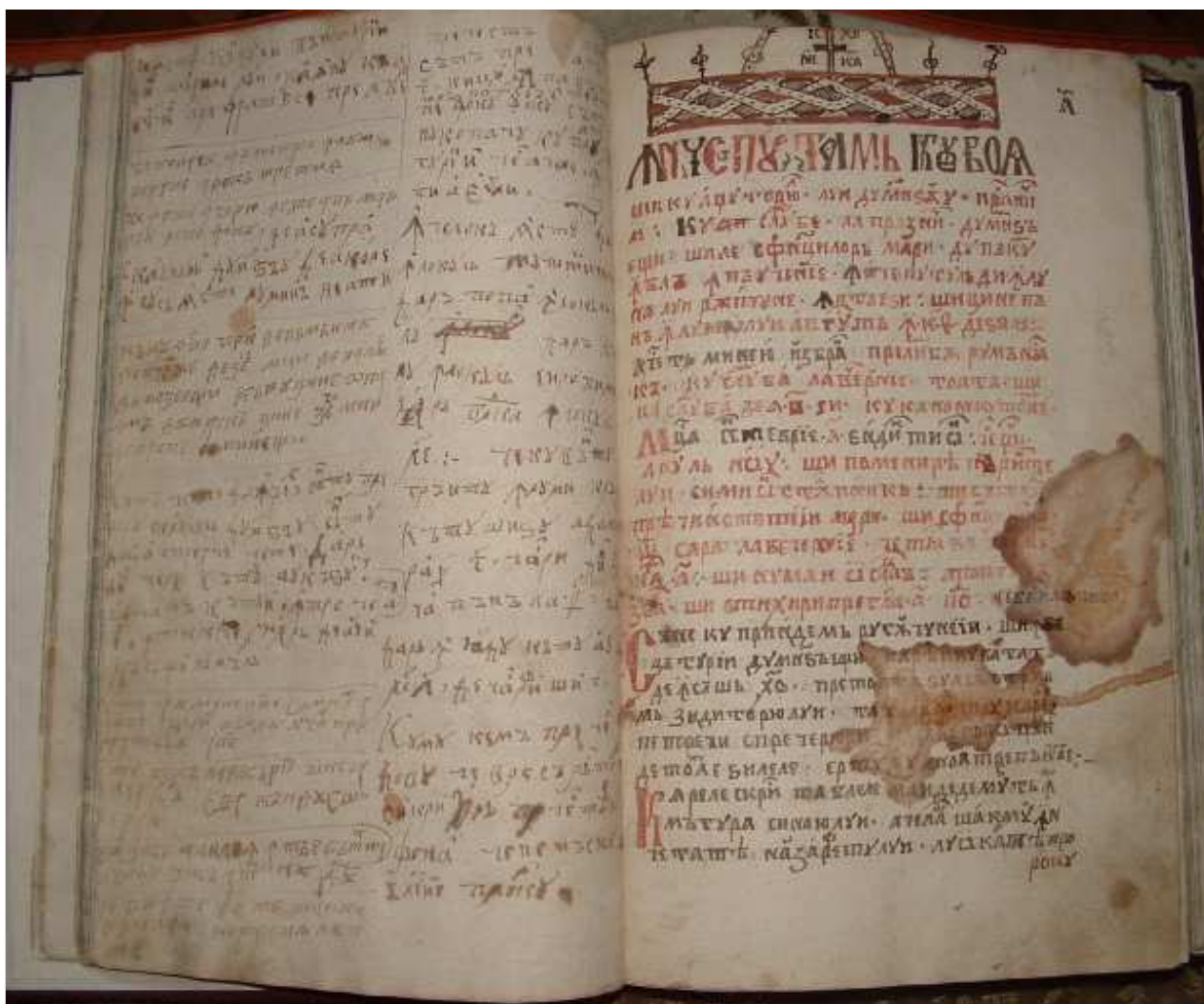
Carte de pre ruditu lumii (ms. Gyula)

„Și fece Domnedzeu tărie și despărți apele ce