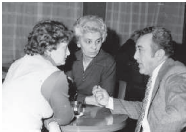
Cu colege din Chitighaz și Bătania

Munca lui de inspector a fost recunoscută de către județul Bichiș prin distincția „Placheta Czabán Samu”. Tot în această perioadă primește și distincția „Pentru cultura socialistă”.